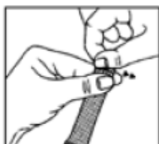
Apretar y rasgar