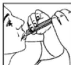
Llevar a la boca presionar y extraer

Si los síntomas empeoran o persisten después de 7 días debe consultar a su médico.